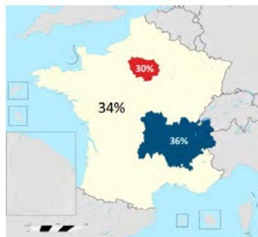
Pourcentage du nombre de projets financés par régions